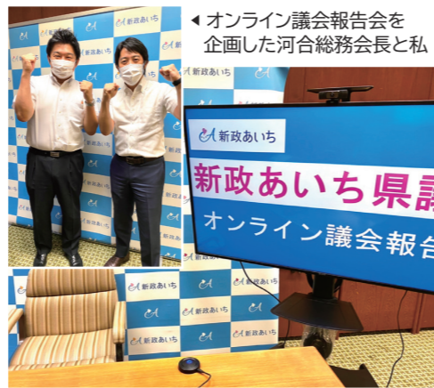
▲ オンライン議会報告会を企画した河合総務会長と私