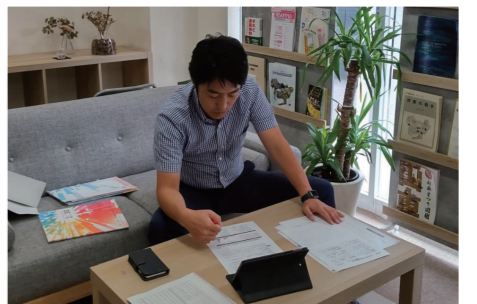
▲ 事務所でのWebによる意見交換の様子

とはいえ、基本はあくまで現地現物、日常を取り戻す中で、一人でも多くの方から「声を聴く」活動にこれからもしっかり取り組む決意です。