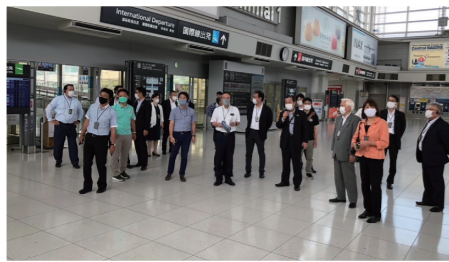
▲ コロナ禍で閑散とする中部国際空港を視察【観光・地域振興議連】