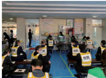
▲ ワクチン集団接種訓練 (あま市 保健センター)