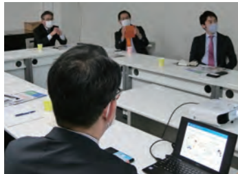
▲ 「健康と食」の勉強会 (大府市 アバックス)