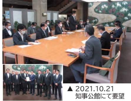
▲ 2021.10.21 知事公館にて要望

2021年は4回の定例議会に併せて臨時国会が10回開催されるなど、通年議会さながら、まさにコロナに振り回される形となりました。(国会はなかなか臨時国会を開きませんでしたが多)。