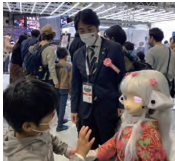
▲ ロボカップ (常滑市 Sky Expo)