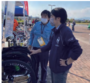
▲ サイクルフェスで 技術を学ぶ(蟹江町)